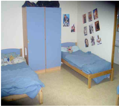
Une chambre à l'internat.

Ils bénéficient des activités du mercredi après-midi.